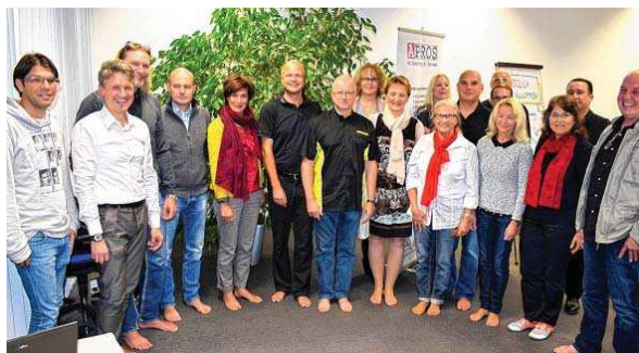
Einige der interessierten Event-Teilnehmer nach der Fußmessdruckanalyse