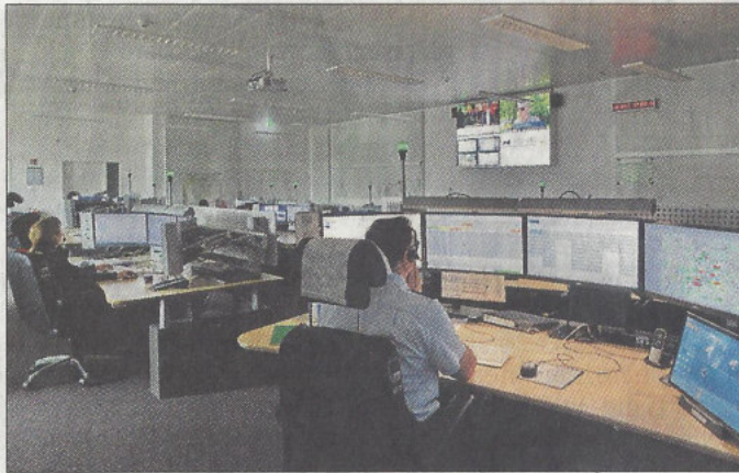
Im Sprechfunkraum gehen die Notrufe ein.

REUTLINGEN. Das Szenario könnte so zutreffen: Ein Bombenanschlag wurde auf den Stuttgarter Flughafen verübt, durcheinander schreiende Menschen, erste Notrufe, die eingehen. Zum Glück ist alles nur nachgestellt. In Form einer Power-Point-Präsentation im Lage-Raum des Erweiterungsbaus des Polizeipräsidiums Reutlingen. Riesige Videowände sowie modernste Informations- und Kommunikationstechnik prägen den Raum.