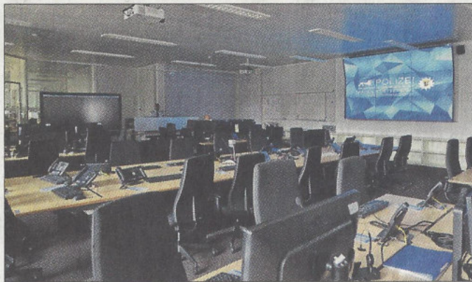
Das hochmoderne Führungs- und Lage-Zentrum: Dort tauscht sich der Einsatzstab im Ernstfall aus.

Das neue Führungs- und Lagezentrum wurde in gut zwei Jahren Bauzeit realisiert. Es befindet sich in der Bismarckstraße 60, auf dem Areal des ehemaligen Technikums für Textilindustrie in Reutlingens Oststadt – einem städtebaulich sehr schönen und spannenden Teil der Stadt.