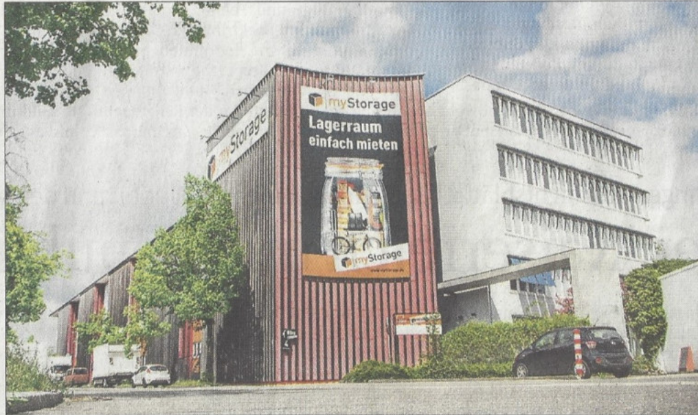
Ob es nun einfach ist oder man den Lagerraum einfach mieten kann, bleibt jedem selbst überlassen. Das große Banner in der Storlachstraße, direkt hinter der Tankstelle, ist nicht zu übersehen.

Das Lagerzentrum liegt in verkehrsgünstiger Lage in der Storlachstraße 4 und ist Teil einer Gruppe von vier Lagerzentren, die über Süddeutschland verteilt sind. Vom Reutlinger Gebäude ist man in nur fünf Minuten am Bahnhof oder in der Innenstadt. Mit der Erweiterung verfügt die Zweigstelle nun über 400 Lagerräume mit je einem bis 50 Quadratmetern.