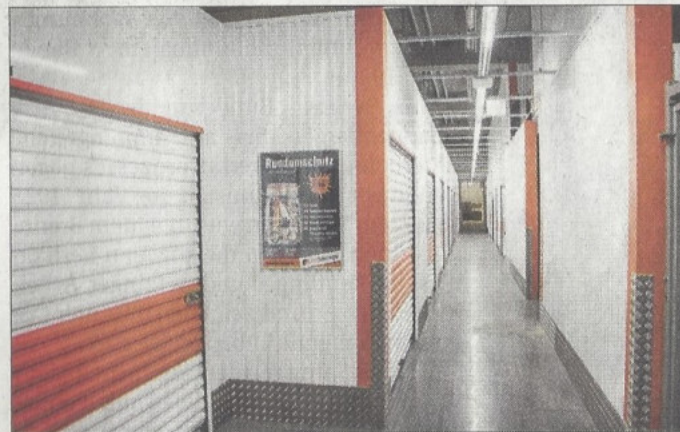
Lagerraum einfach mieten: »my storage« in der Reutlinger Storlachstraße ist jetzt erweitert.