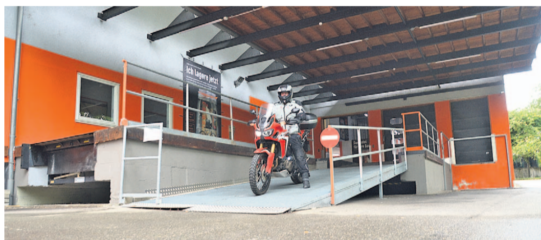
Zur Anlieferung von einzulagernden Dingen steht den Kunden eine ausreichend dimensionierte Rampe zur Verfügung.