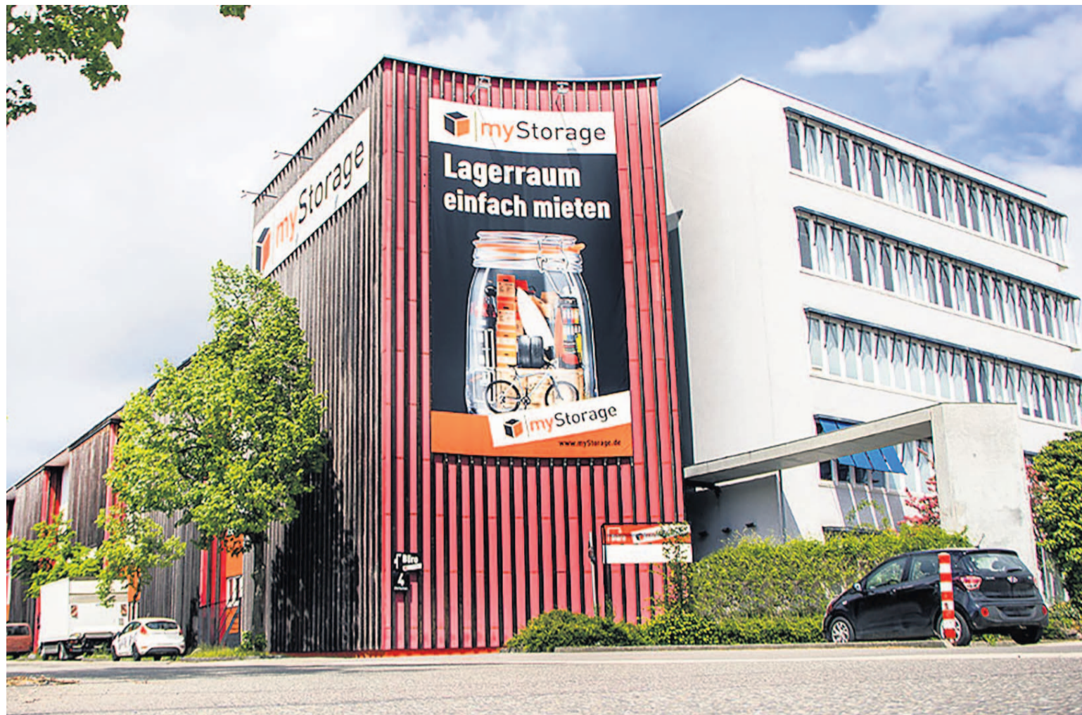
myStorage ist in der Reutlinger Storlachstraße 4 zentral gelegen – so lässt sich bequem alles einlagern, was in der Wohnung oder Firma zu viel Platz wegnimmt.