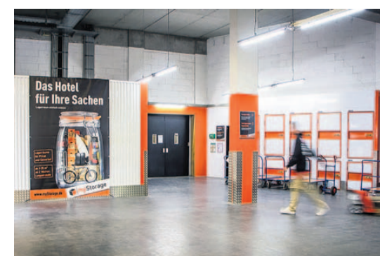
Die Lagerflächen sind sauber, trocken und klimatisiert. Für Gegenstände verschiedenster Größen ist der passende Lagerplatz verfügbar.

Manche Kunden kommen vorbei und haben die Dinge, die eingelagert werden sollen, schon dabei. »Für die flexiblen Mitarbeiter von myStorage kein Problem«, sagt Tobias Kirst. Die allermeisten Kunden können ihren Lagerplatz sofort nutzen. (apros)