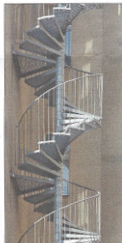
Zweckmäßig und elegant: eine Metalltreppe.

Fenster, Türen, Tore, Treppen, Geländer, Wintergärten, Vordächer, Öfen und Kamine: Metallhandwerk macht das Leben schön. Der Werkstoff Metall hat viele Vorzüge. Seine Festigkeit und Formbarkeit machen ihn überall dort unverzichtbar, wo für die Ewigkeit gebaut wird oder für dauerhaft