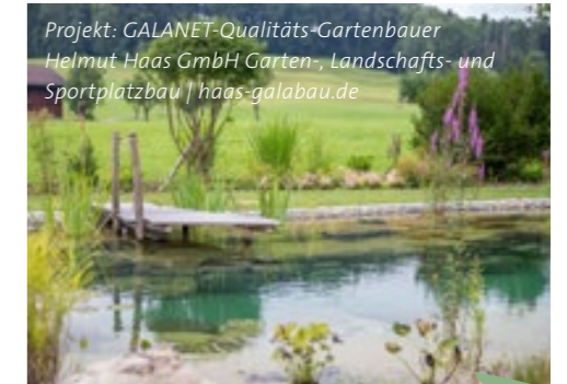
Projekt: GALANET-Qualitäts-Gartenbauer Helmut Haas GmbH Garten-, Landschafts- und Sportplatzbau | haas-galabau.de

Gärten sind individuell. Deshalb sind die Schwerpunkte, die wir in diesem Artikel nennen, selbstverständlich auch so zu behandeln. Ob Ihr Rasen zusätzlich noch eine Belüftung, Ihre Koikarpfen besondere Behandlung benötigen oder Ähnliches – das kommt ganz auf Sie, Ihren Garten und Ihre Gartenkenntnisse an. Und Sie wissen ja, wenn Sie Fragen haben, an wen Sie sich wenden können.